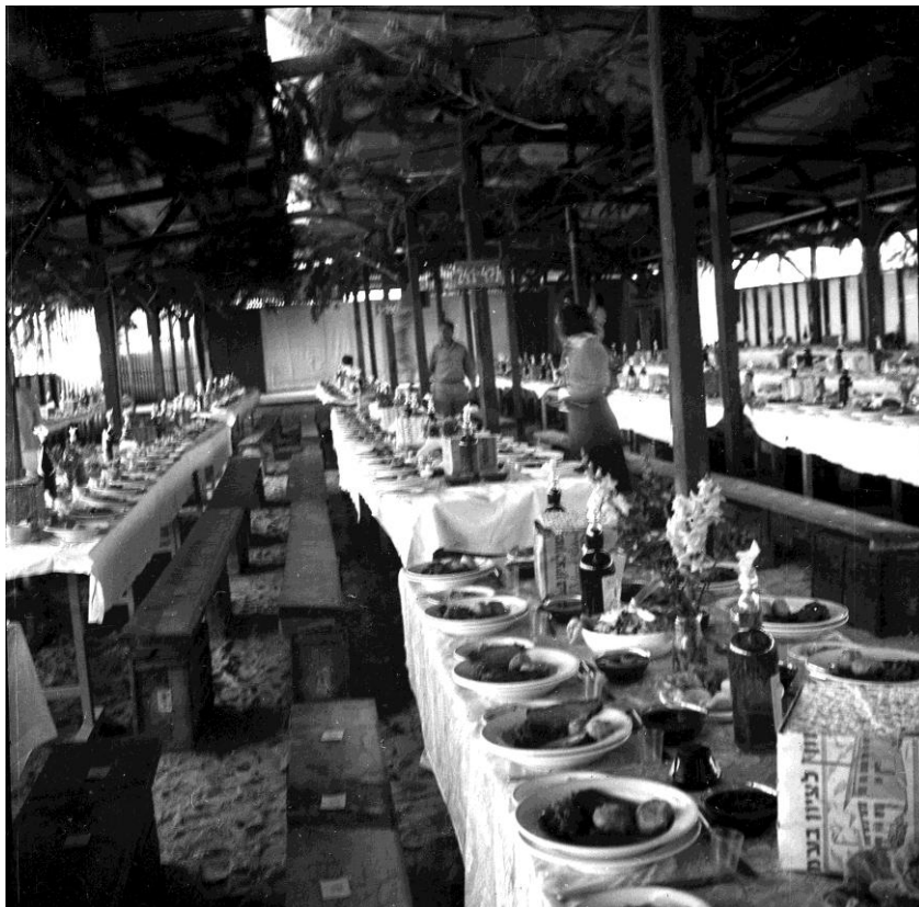
ליל סדר בקיבוץ

מאז, כל פעם שיש לי חום גבוה שמלווה תמיד בצמא, אני נזכרת בקערת החמוצים שחיסלתי, (אבל הפעם שותה מיץ פטל) ובאחות שנולדה לי במפתיע ואיך כשכבר למדתי לשקר, תמיד היה לי תירוץ מספיק טוב (לדעתי), בכדי שאוכל לצאת החוצה מהסדר ולהעדר מהאולם בהגיע תורו של אבי לשיר על "האנשים התועים ושצריכים לקום במדבר ועוד הדרך רב". וגם באחות של מרקה שמאז אותו ליל סדר ראיתי אותה עוד מספר פעמים, אוכלת את הדג ומה שמתלווה לזה, עד שיותר לא הגיעה.